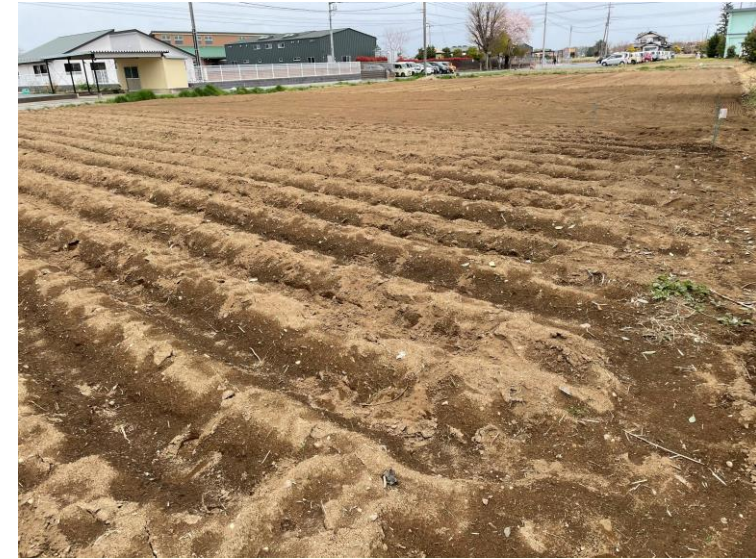
じゃがいもの植え付け

ニッコクトラストは、埼玉県深谷市に障がい者を雇用する農園「ニッコクファーム」を開園しました。株式会社アクアライフ.JPによる農業指導の協力を得て、当社の農場管理者と障がい者が農園の運営管理を行います。ニッコクトラストは、SDG'sの取り組みの一つとして食材となる野菜の栽培農業を行い、その中で障がい者の方の雇用と自立支援、地域が目指す産業振興と交流の全てを満たすことが出来る農福連携事業に取り組みます。